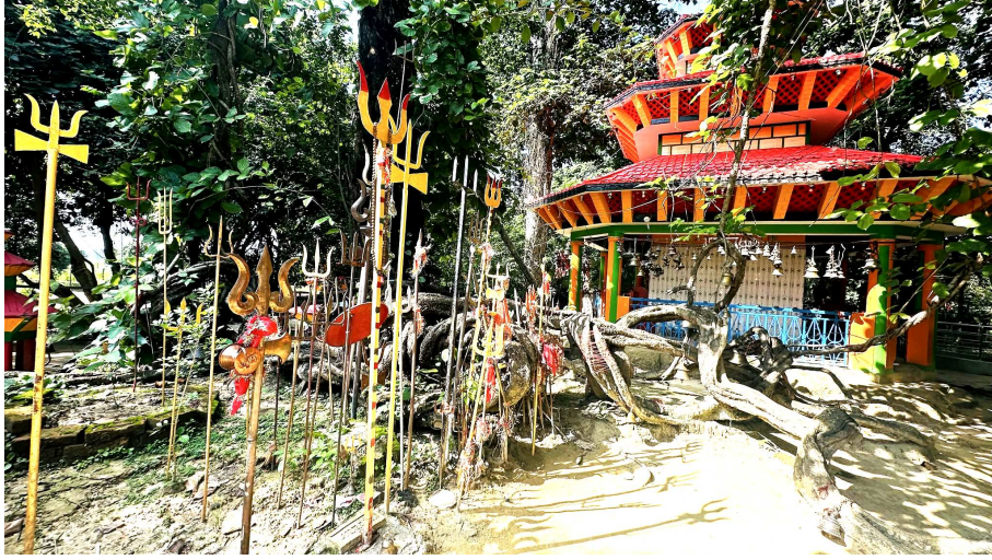
सिरहाको लहान नगरपालिका-१५ स्थित ढोडनामा अवस्थित राजदेवी मन्दिर।